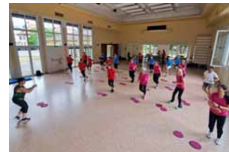
Plateforme FlowTonic Fête cantonale adultes 2023

— Trouver une date pour partager les spaghettis !!