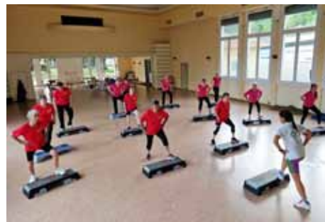
Plateforme aérobic Fête cantonale adultes 2023