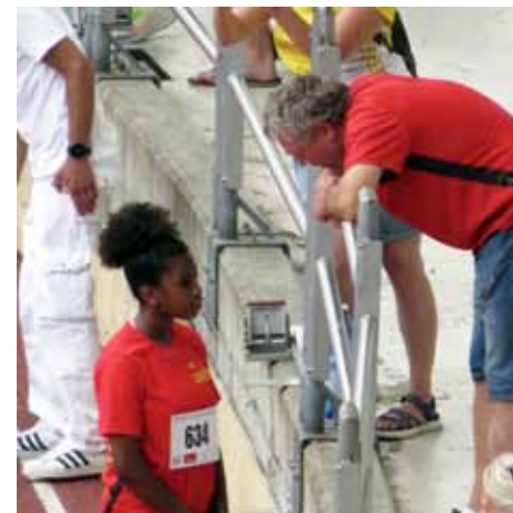
Complicité entre athlètes et coach.