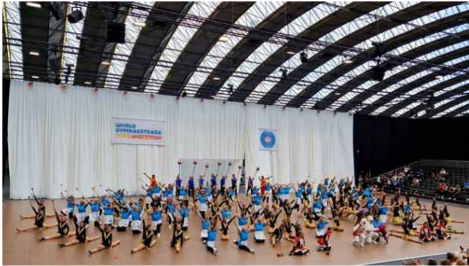
Team Romandie avec l'URG Open Age.

et où, en fin de semaine, les échanges d'équipement sont un autre sport traditionnel lors de la Gymnaestrada.