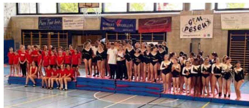
Podium U17 : 1. La Coudre 2. La Coudre 3. Gym Peseux.